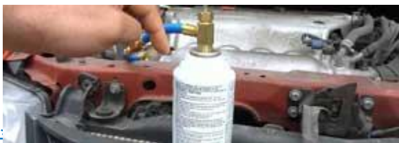
نحوه شارژ گاز کولر خودرو

15. در آخر تست کنید که همه دکمه ها درست و به جای خود کار می کنند یا نه. اگر مشکلی نبود کار تمام است و اگر باز مشکلی در مسیر بود همه مراحل را از ابتدا باز کرده و دوباره امتحان کنید.