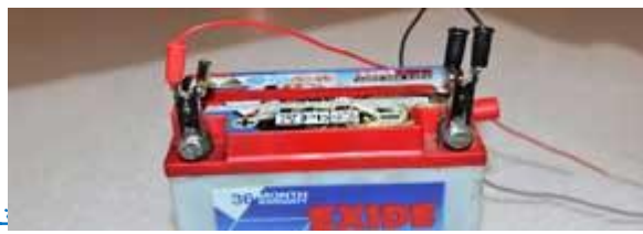
نحوه شارژ باطری ماشین

همچنین خود آینه را بررسی کنید که ممکن است آسیب دیده باشد. با توجه به این که آینه بغل ها جنسی پلاستیکی دارند، در خودروهای معمولی که جمع شدن آن ها با دست است و احتمال فراموشی وجود دارد، شاید بر اثر خوردن ماشین یا رهگذران نیز آسیب ببینند، ولی برای خودروهایی که برقی هستند درست است که موقع پارک کردن به صورت خودکار جمع می شوند، اما در حالت کلی عواملی غیر از تصادف مثل فرسوده شدن به مرور زمان در زیر باران، برف و ... خراب شده و نیاز به تعویض داشته باشند.